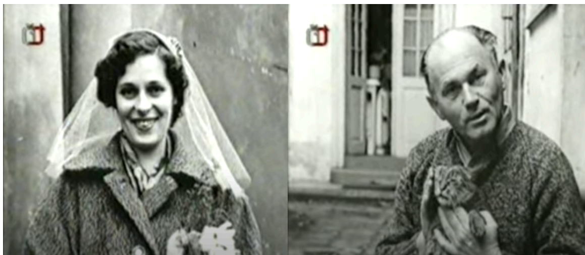
Eliška et Bohumil Hrabal devant leur piaule du quartier de Liben, à Prague.

4 juin 2023 : La Mégisserie - scène conventionnée de Saint-Junien. 3 avril 2024 : Théâtre du Cloître - Scène conventionnée de Bellac. 29 mai 2024 : Théâtre Expression 7 à Limoges.